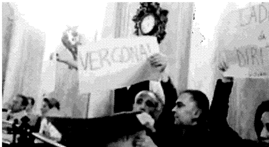
GIOVENTÙ DEMOCRATICA. I cartelli contro l'omofobia esposti durante il consiglio provinciale

■ Bocciata la mozione a tutela dei diritti del mondo gay: il centrosinistra insorge