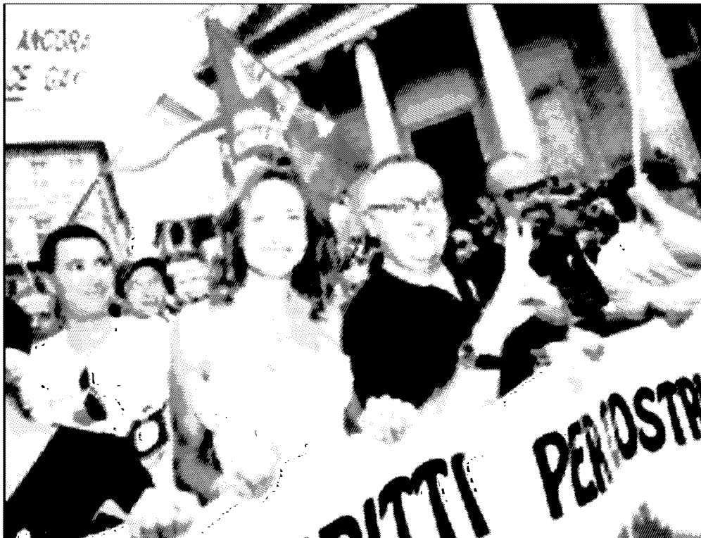
Manifestazione di omosessuali e lesbiche con Luxuria e Franco Grillini